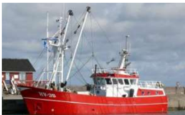
Kutteren HV 35 "Cicilie"