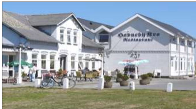
Havneby Kro 74 75 75 35