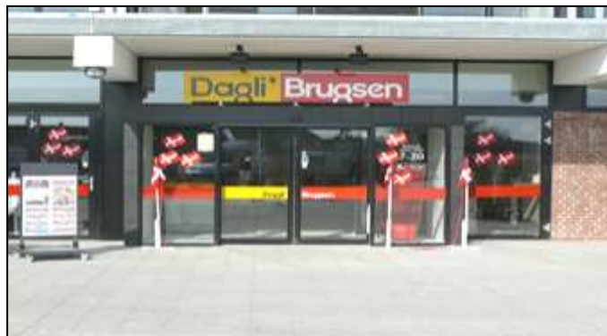
Dagli' Brugsen 73 71 07 00