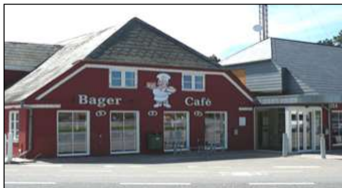
Rømø Bageri 74 75 52 44