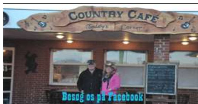
Country Cafe Rømø 20 10 57 77