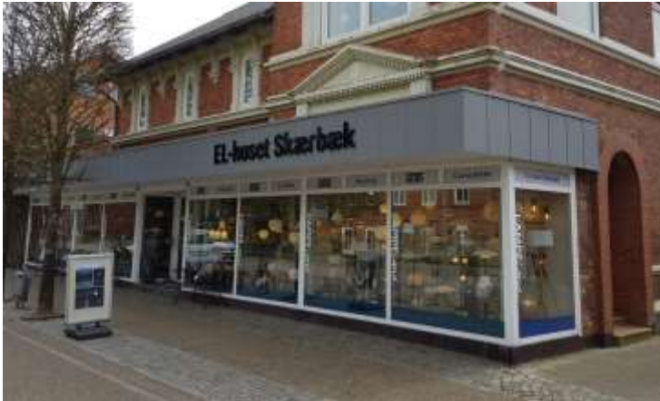
EL-Huset Skærbæk 74 75 13 13