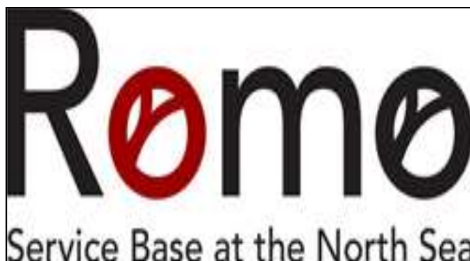
Rømø Havn 74 75 52 45