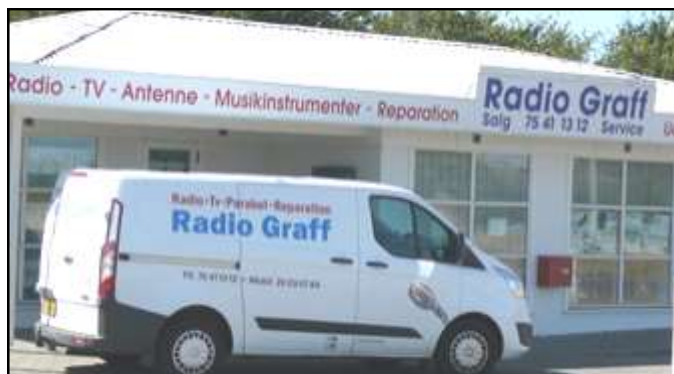
Radio Graff 20 23 07 84