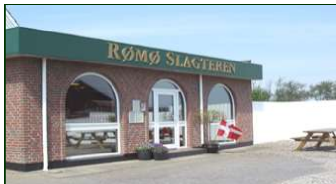
Rømø Slagteren 29 90 75 16